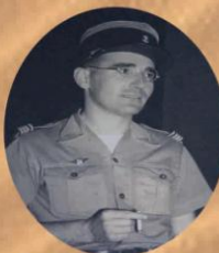
Félix Broche surnommé le «Metua»

Le 9 juin, deux jours avant la sortie, lors d'une attaque générale, il perd son chef, le lieutenant-colonel Broche et son adjoint le capitaine de Bricourt. Pour tous les tahitiens, c'est un véritable drame, « Papa » c'est ainsi qu'ils appelaient ou interpellaient leur colonel est mort !!!!