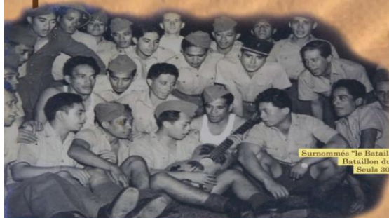
Surnommés «le Bataillon des guitaristes», les 600 volontaires du Bataillon du Pacifique ont mené de rudes batailles. Seuls 300 d'entre eux ont survécu.